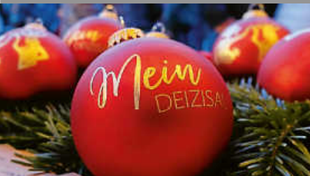
Standplatzbewerbung für den Weihnachtsmarkt