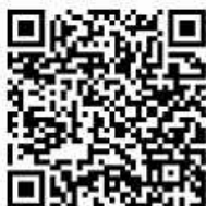
QR-Code: Sachspenden- Team

Haushaltsauflösungen können wir nicht vornehmen, sollten Sie jedoch etwas anbieten können, das Sie weiterhin bei sich zu Hause lagern können, so freuen wir uns, wenn Sie uns wissen lassen, worum es sich handelt.