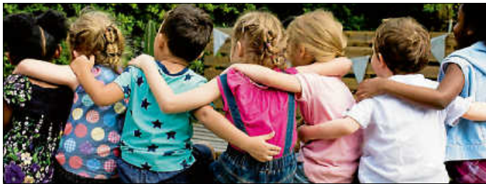
Kinder machen unser Leben bunter!

Weitere Informationen finden Sie auf: www.tageselternverein-kreis-es.de