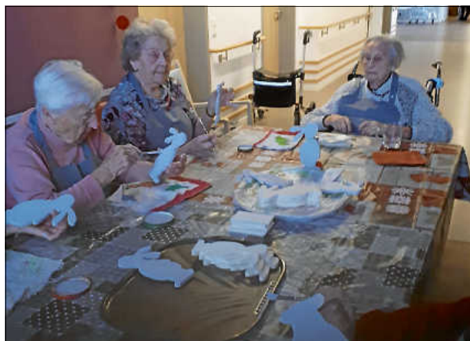
Mit Begeisterung werden die Osterhasen gefertigt

Die kleinen Kunstwerke schmücken nun die Tische der Wohnbereiche und ergänzen die zahlreichen interessanten Bastelarbeiten, die regelmäßig unter Anleitung von Rose Hädelt entstehen. Ostern kann also kommen.