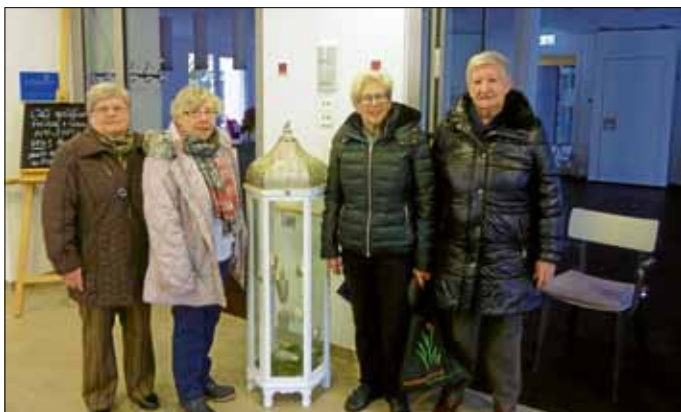
Die Ehrenamtlichen sind für den Marktbesuch gerüstet.

Für die Ehrenamtlichen war es eine Selbstverständlichkeit, den Wunsch der Bewohner zu erfüllen. Auch wenn der Besuch wetterbedingt nicht so lange dauerte wie im Vorjahr, für die Bewohner unseres Hauses war er eine willkommene Gelegenheit, sich auf Weihnachten einzustimmen.