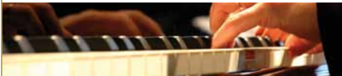
Die Zehntscheuer ist eine Einrichtung von KJRES e.V. und Gemeinde Deizisau

Teilnahmegebühr: 2,- €, Voranmeldung NICHT erforderlich.