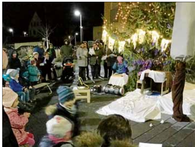
Stimmungsvoller "Lebendiger Adventskalender"

Weihnachtszeit komm und bring uns, die wir vor Sehnsucht brennen, das was uns verloren ging, was wir lange nicht mehr kennen: Ruhe, Frieden, stille Zeit, Freude an kleinen Dingen. Und auch die Gelegenheit, den Mitmenschen zum Lachen zu bringen. Weihnachtszeit, lass uns glauben an ein Fest voller Liebe und Frieden, öffne uns Menschen endlich die Augen, dass wir einander lieben.