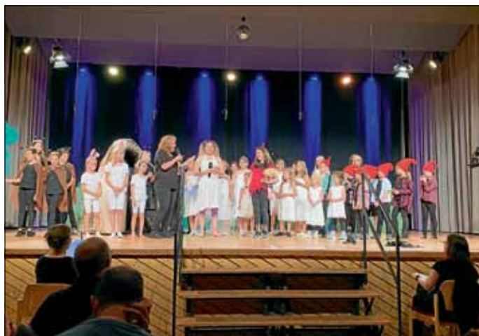
Die Star Kids und die Star Teens bei ihrer Aufführung des Musicals

Unser Dank gilt an erster Stelle den Verantwortlichen der Concordia für eine nicht alltägliche Einladung; natürlich auch den ehrenamtlichen Begleitern, die für den sicheren Weg zum Veranstaltungsort sorgten. Wir danken der Gemeindeverwaltung für die Bereitstellung des „Mobilo“ und Hermann Ertinger für seine Bereitschaft, den Bus zu fahren.