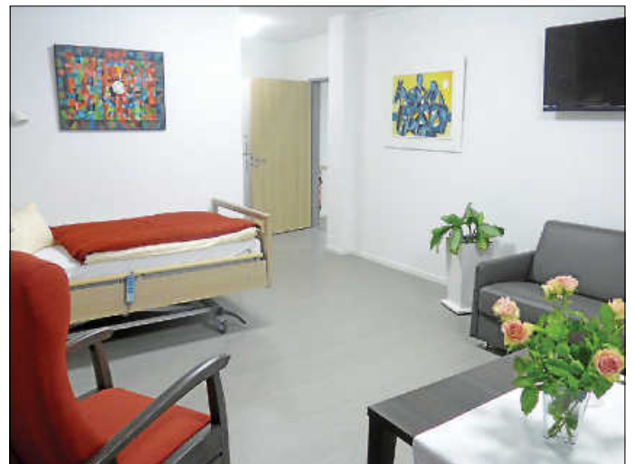
Cicely-Saunders-Zimmer in Deizisau