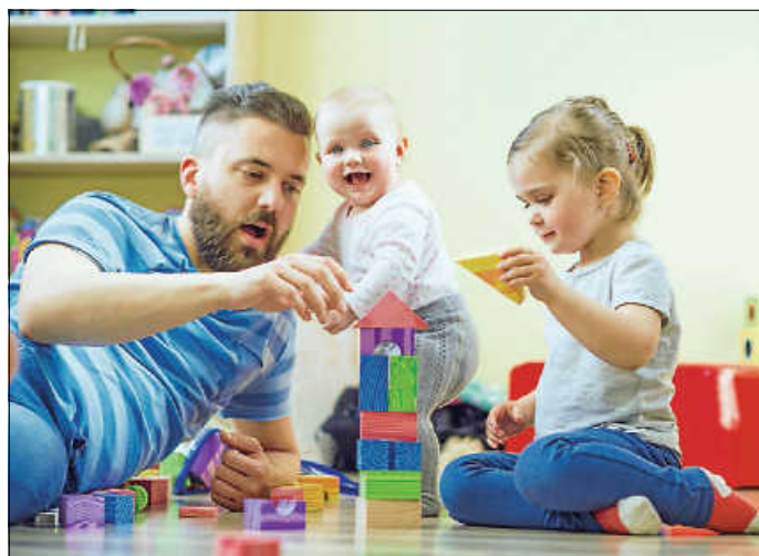
Weil die Kleinen für mich das Größte sind!