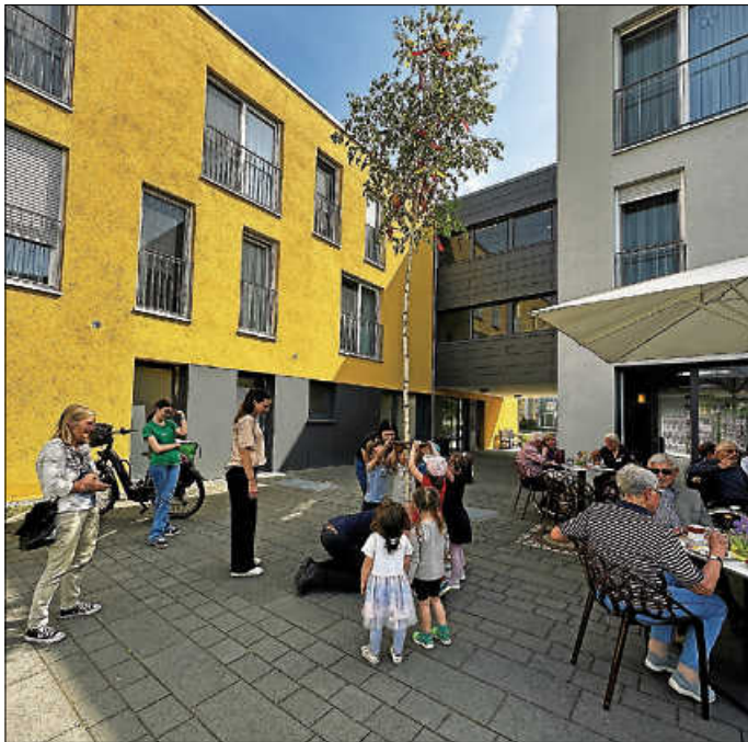
Mit kräftigem „Hau Ruck“ wird der Maibaum aufgestellt

Wir bedanken uns im Namen unserer Bewohner bei allen, die in irgendeiner Weise zum Gelingen dieses Festes beigetragen haben.