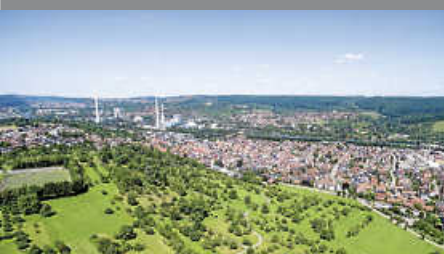
Befragung zum Mietspiegel