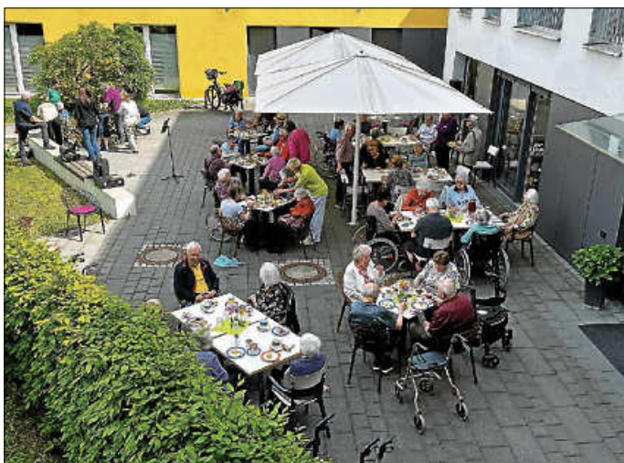
Die Bewohner begrüßen den Mai