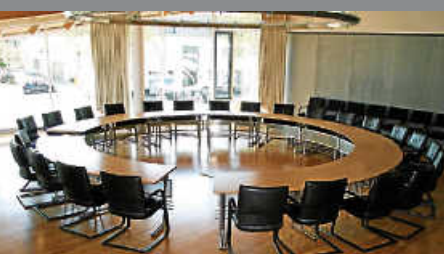
Einladung zu einer Sitzung des Gemeinderates