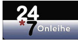
Grafik: Online-Bibliothek 24*7

Ich packe meinen Koffer und nehme mit ... Kennen Sie das Problem? Sie wollen in den Urlaub fahren und haben nur einen sehr begrenzten Platz zur Verfügung. Der Koffer ist schon voll, im Auto stapeln sich sperrige Strandutensilien und eigentlich wollten Sie doch dieses Mal nur mit leichtem Gepäck verreisen. Aber die erholsamen Stunden am Urlaubsort wäre ja nur halb so schön, wenn Sie auf Ihre Ferienlektüre verzichten oder diese schon im Vorfeld auf ein Minimum reduzieren müssten. Dank der 24*7 Onleihe ( www-onleihe.de/247online-bibliothek ) Ihrer Bücherei können Sie dieses Szenario getrost vergessen. Mit einem kleinen Endgerät wie Tablet oder E-Book-Reader ist unsere riesige Auswahl an digitalen Medien nur einen Knopfdruck weit entfernt, egal, wohin Sie Ihre Reise führt. Einfach mit Ihrem Büchereiausweis unserer Bücherei downloaden. E-Books können bis zu drei Wochen kostenlos entliehen werden.