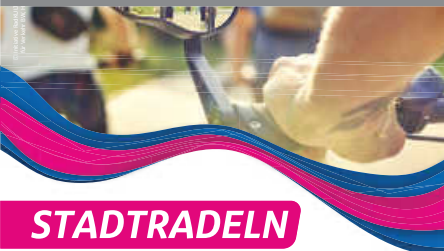
STADTRADELN vom 17.06. – 07.07.24