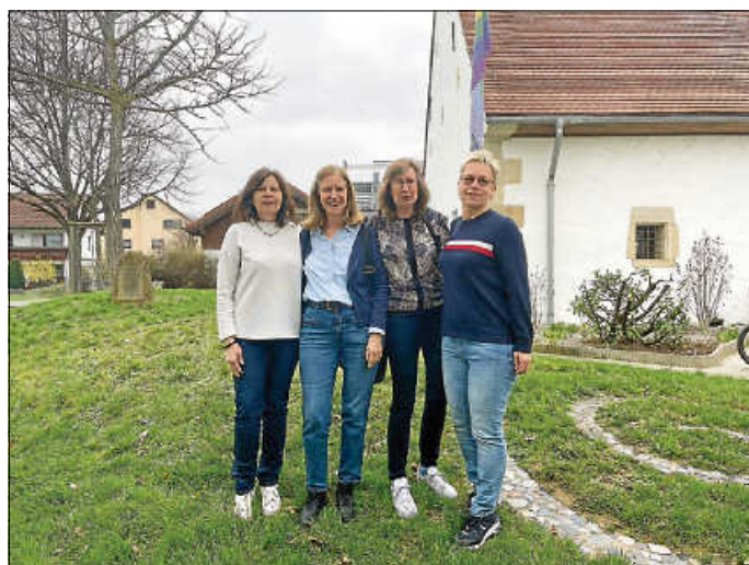
Team des „Café Vergissmeinnicht“