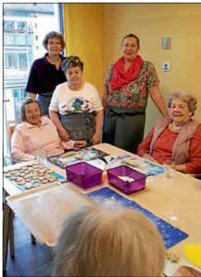
Fleißige Bäckerinnen im Palmschen Garten

Dafür möchten wir uns an dieser Stelle herzlich bedanken.