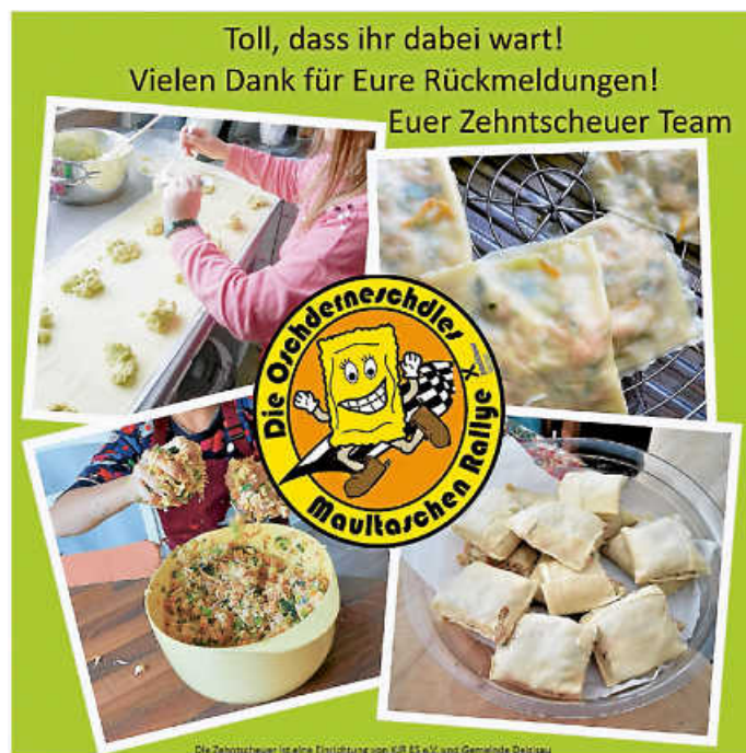
Grafik: Jochen Lung-Müller

An dieser Stelle nochmal vielen Dank an alle, die sich an unserer Oster-Rallye beteiligt haben!