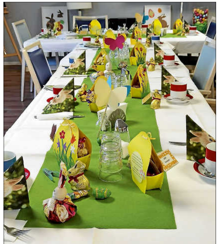
Festlich dekorierte Tafeln laden ein