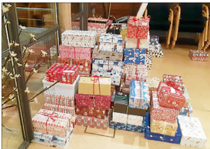
Päckchenberg für die Weihnachtspäckchen Aktion