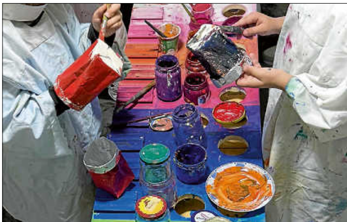
Bei der Umweltbildungswoche in ihrem Wohnumfeld sorgten Grundschul Kinder für eine neue Nutzung ausgedienter Milchtüten, aus denen sie bunte Pflanzgefäße herstellten.