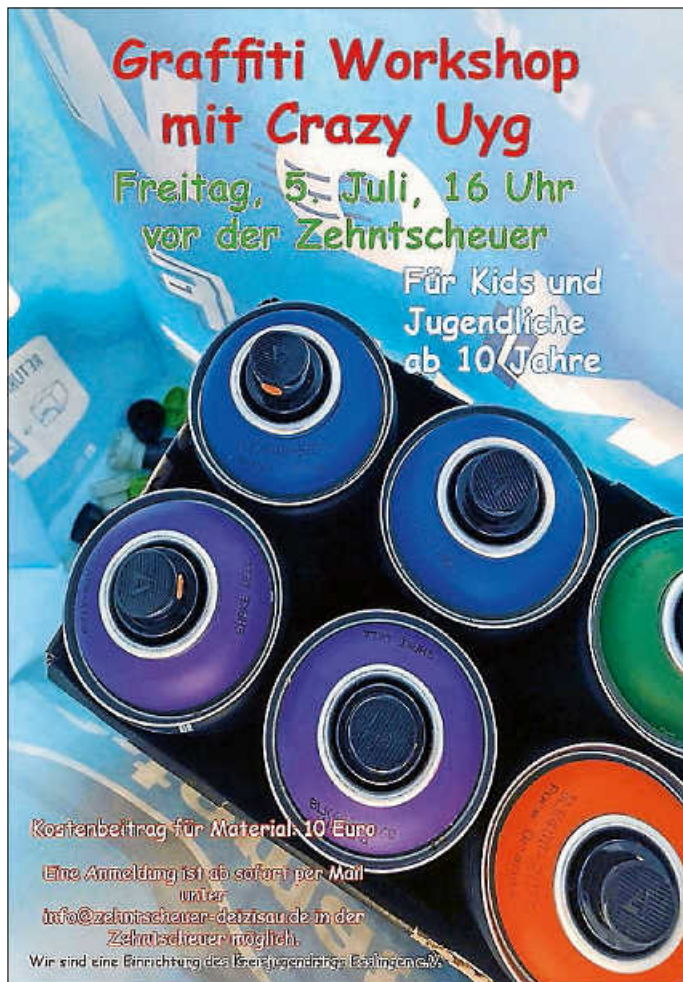
Plakat: Zehntscheuer Deizisau

Informationen zur Anmeldung und Details zu den beiden Tagen findet ihr auf der Homepage der Zehntscheuer: www.zehntscheuer-deizisau.de