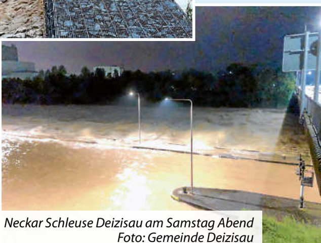
Neckar Schleuse Deizisau am Samstag Abend