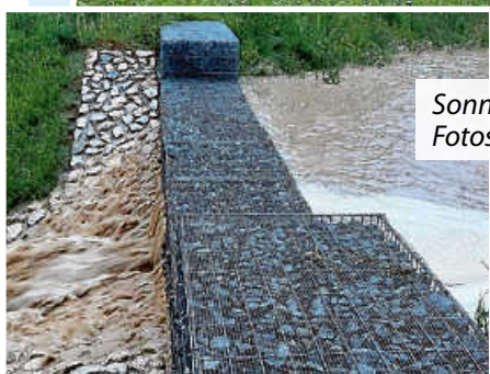
Sonntag Abend