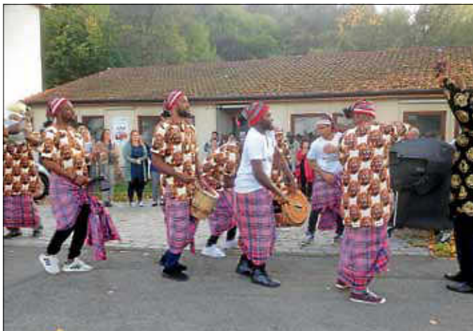
Igbo-Cultural-Group aus Stuttgart