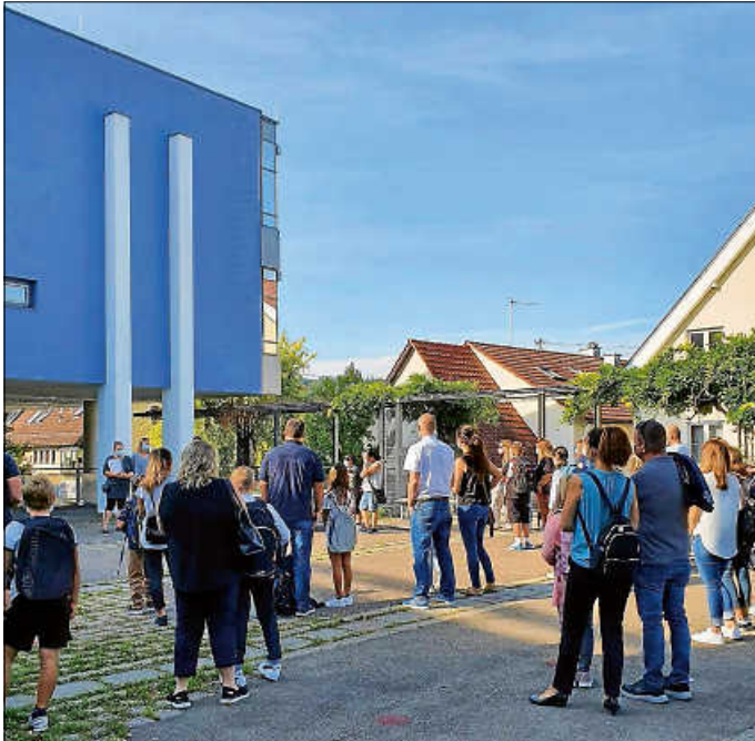
Kaiserwetter zum Schulanfang