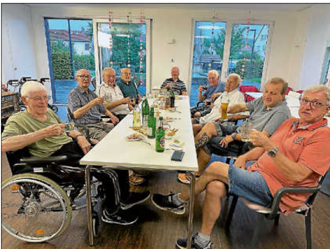
Beim Männerstammtisch kommt die Geselligkeit nicht zu kurz

Unser Palmscher Garten hat für seine männlichen Bewohner ein weiteres, den Alltag bereicherndes Angebot. Dabei ist besonders bemerkenswert, dass Idee und Umsetzung von den Bewohnern selbst initiiert wurden und nun auch organisiert werden. Bei diesem Projekt, dem Männerstammtisch, haben neben aktuellen Themen von Sport und Gemeindepolitik, vor allem alte Deizisauer Geschichten und Begebenheiten einen besonderen Platz. Kein Wunder, denn die Deizisauer können auf ihre Persönlichkeiten und Originale stolz sein. Deren Geschichten stoßen ohne Frage auch bei „Neudeizisauern“ auf Interesse und entlocken doch häufig ein Schmunzeln. Der Männerstammtisch ist schon deshalb eine gelungene Veranstaltung, weil sie bei allen Teilnehmern Erinnerungen wach werden lässt und somit eine interessante Geschichte nahtlos die nächste Erzählung folgen lässt. Das von den Bewohnern selbst gesetzte Ziel, ihren Alltag auch noch selbst zu gestalten, gelingt mit ihrem Männerstammtisch bestens. Glückwunsch!