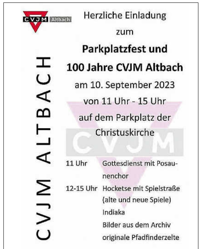
Plakat: KG Altbach

Parkplatzfest des CVJM Altbach mit Posaunenchor aus Altbach und Deizisau vor der Christuskirche Altbach (Pfr. Bauspieß)