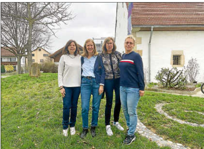
Team des „Café Vergissmeinnicht“

Unser Betreuungsnachmittag richtet sich an ältere Menschen, die gerne gesellige Stunden mit Spaß und Freude verbringen möchten. Wir verfolgen mit unserem Angebot das Ziel, pflegenden Angehörigen die Möglichkeit zu bieten, regelmäßig einen freien Nachmittag zu genießen. Älteren Menschen mit Betreuungsbedarf bieten wir einen geselligen Rahmen und ein Programm, das ihren jeweiligen Bedürfnissen angepasst ist.