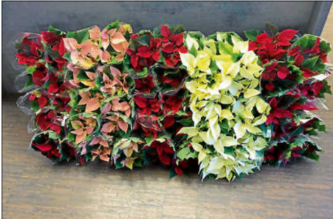
Die Fa. Hornbach übergab 50 Weihnachtssterne an die Bewohner

Wir bedanken uns herzlich bei der Leitung des Bau- und Gartenmarktes Hornbach , Esslingen, für die gelungene Überraschung.