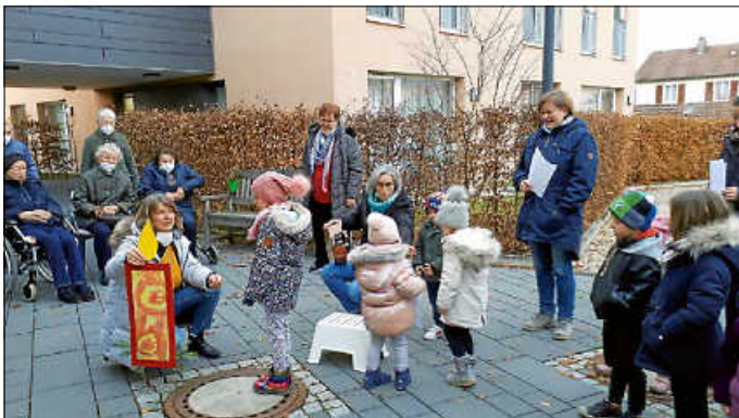
Unsere Kindergartenkinder bei der Übergabe der Weihnachtskerze

Nach Übergabe der jeweiligen Präsente konnten sich alle fleißigen Bastler mit Punsch und Lebkuchen stärken.