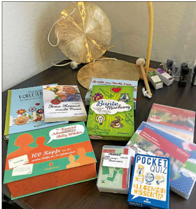
Ein Team von Verantwortlichen wählte neue Spiele aus.