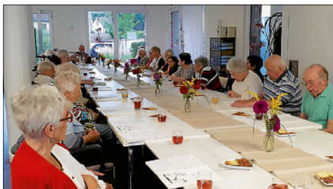
Der Dämmerchoppen erfreute wieder unsere Bewohner.