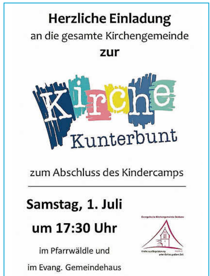
Plakat: Diakonin Klamert

Dienstag, 27. Juni 20 Uhr Kirchenchor Probe Mittwoch, 28. Juni 12 Uhr Seniorenmittagstisch, evang. Gemeindehaus 14.00 Uhr Konfiunterricht, Gruppe 1 im Gemeindehaus, Jungscharraum 15.45 Uhr Konfiunterricht Gruppe 2 im Gemeindehaus, Jungscharraum Donnerstag, 29. Juni 9.45 Krabbelgruppe, evang. Gemeindehaus (Informationen für neue, interessierte Eltern über das Gemeindebüro) 16 Uhr Trauercafé Regenbogen in Plochingen (mehr unter Rubrik Hospiz) Freitag, 30. Juni Ab 15 Uhr startet das Kindercamp im Pfarrwäldle Samstag, 1. Juli 17.30 Uhr Kirche Kunterbunt zum Abschluss des Kinder-camps im Pfarrwäldle