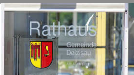
Rathaus bis zum 01.01.2025 geschlossen