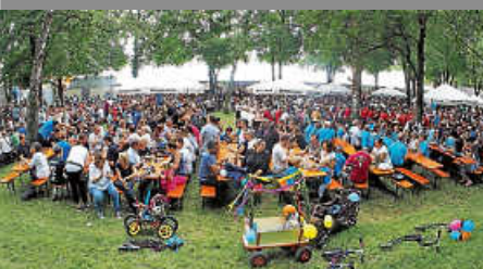
Reservierung des Geschirrmobils