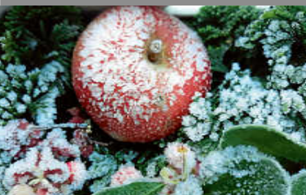
Erinnerung an Räumpflicht