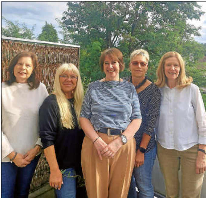
Team des „Café Vergissmeinnicht“

Unser Betreuungsnachmittag richtet sich an ältere Menschen, die gerne gesellige Stunden mit Spaß und Freude verbringen möchten. Wir verfolgen mit unserem Angebot das Ziel, pflegenden Angehörigen die Möglichkeit zu bieten, regelmäßig einen freien Nachmittag zu genießen. Älteren Menschen mit Betreuungsbedarf bieten wir einen geselligen Rahmen und ein Programm, das ihren jeweiligen Bedürfnissen angepasst ist.