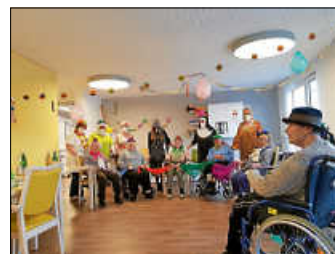
Fotos: Fasching im Palmschen Garten