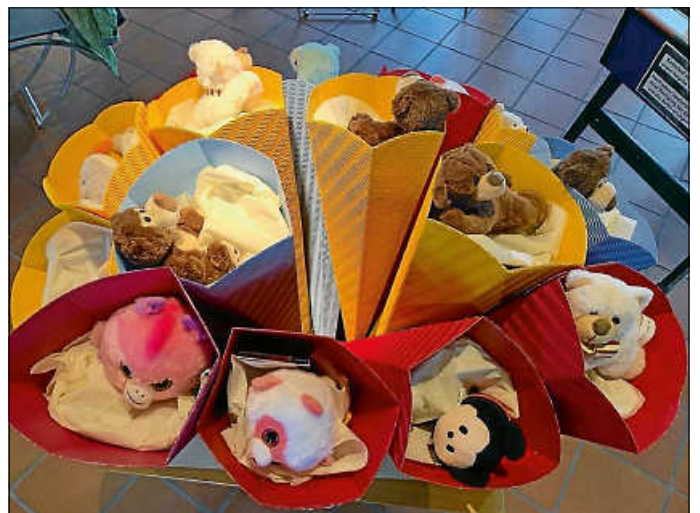
Begrüßungsschultüten für ukrainische Kinder

Vielen Dank für die großartige Unterstützung der Ukraine-Hilfe Deizisau!