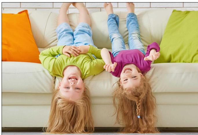
Kinder machen unser Leben bunter!

Für diese anspruchsvolle Aufgabe ist eine Qualifizierung von 300 Unterrichtseinheiten erforderlich. Wenn Sie Interesse haben, wenden Sie sich gerne an die für Sie zuständige Mitarbeiterin des Tageselternvereins Kreis Esslingen. Wir beraten Sie ausführlich rund um das Thema Kindertagespflege und Qualifizierung. Wir freuen uns auf Sie! www.tageselternverein-kreis-es.de