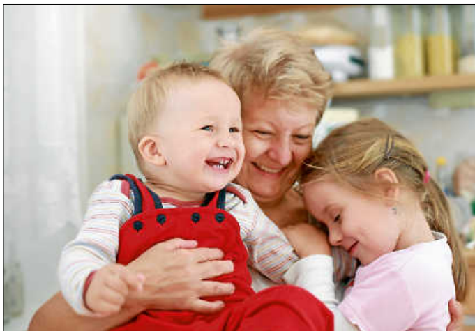
Mein Alltag mit Kindern-für mich das Schönste!

Der nächste Qualifizierungskurs startet dieses Jahr im Oktober in Denkendorf. Die Qualifizierung ist in Kurs I (vorbereitende Qualifizierung mit 50 UE) und Kurs II (praxisbegleitende Qualifizierung mit 250 UE) gegliedert. Pädagogische Fachkräfte (nach § 7 KiTaG) sind bereits nach Kurs I vollumfänglich qualifiziert. Die Teilnahme an der gesamten Qualifizierung ist auf Wunsch jederzeit möglich. Vor Kursbeginn und nach Kurs I findet ein Eignungsgespräch mit dem Tageselternverein statt. Bei Interesse an der Qualifizierung zur Tagespflegeperson melden sich interessierte Personen möglichst zeitnah bei der für ihren Wohnort zuständigen Ansprechpartnerin des Tageselternvereins. Diese finden Sie auf unserer Homepage unter www.tev-kreis-es.de