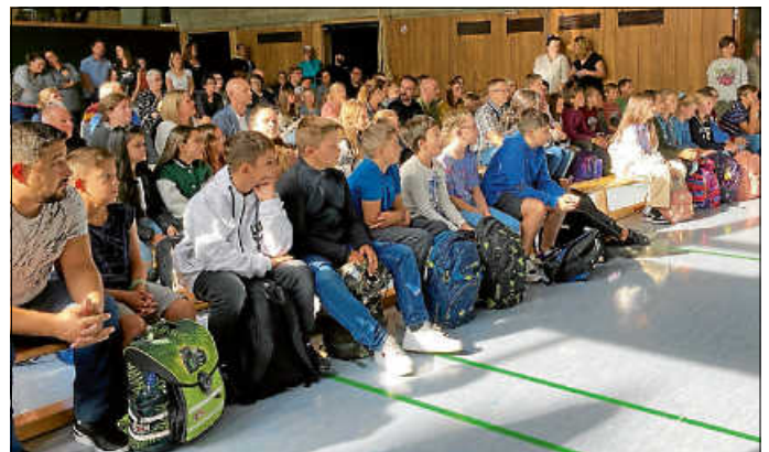
Die neuen 5er