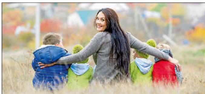
Mein Alltag mit Kindern - für mich das Schönste!

Der nächste Qualifizierungskurs startet dieses Jahr am 07. März in Denkendorf. Die Qualifizierung ist in Kurs I (vorbereitende Qualifizierung mit 50 UE) und Kurs II (praxisbegleitende Qualifizierung mit 250 UE) gegliedert. Pädagogische Fachkräfte (nach § 7 KiTaG) sind bereits nach Kurs I vollumfänglich qualifiziert. Die Teilnahme an der gesamten Qualifizierung ist auf Wunsch jederzeit möglich. Vor Kursbeginn und nach Kurs I findet ein Eignungsgespräch mit dem Tageselternverein statt. Bei Interesse an der Qualifizierung zur Tagespflegeperson melden sich interessierte Personen möglichst zeitnah bei der für ihren Wohnort zuständigen Ansprechpartnerin des Tageselternvereins. Diese finden Sie auf unserer Homepage unter www.tev-kreis-es.de