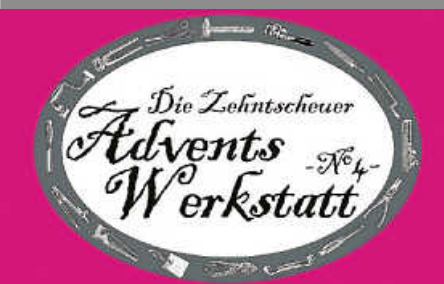
Freitag, 18. Dezember