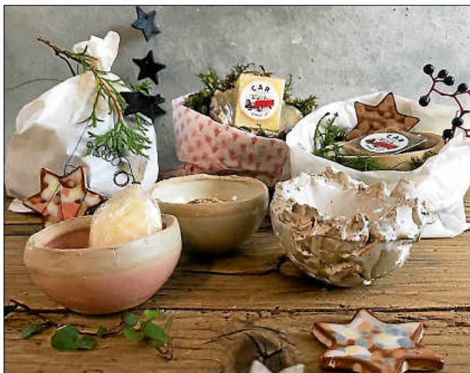
Produkte aus den Werkstätten

Aus der Seifenwerkstatt gibt es verschiedene Seifen aus hochwertigen Inhaltsstoffen. In der Keramikwerkstatt wurden dazu feine Seifenschalen aus Gießton, aber auch Müslischalen produziert. In der Nähwerkstatt wurden bereits viele unterschiedliche Masken genäht, die auch an die Geflüchteten im Asylheim verteilt wurden. Aber auch Stoffbeutel, kleine Brotkörbchen, Bezüge für Wärmeflaschen werden laufend genäht. Ganz neu im Programm sind Federmäppchen und Schlüsselanhänger aus recycelten Fahrradschläuchen.