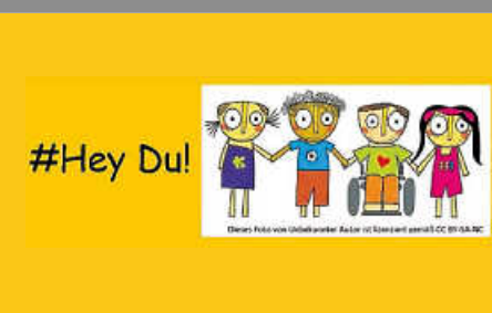
Freitag, 18. Dezember