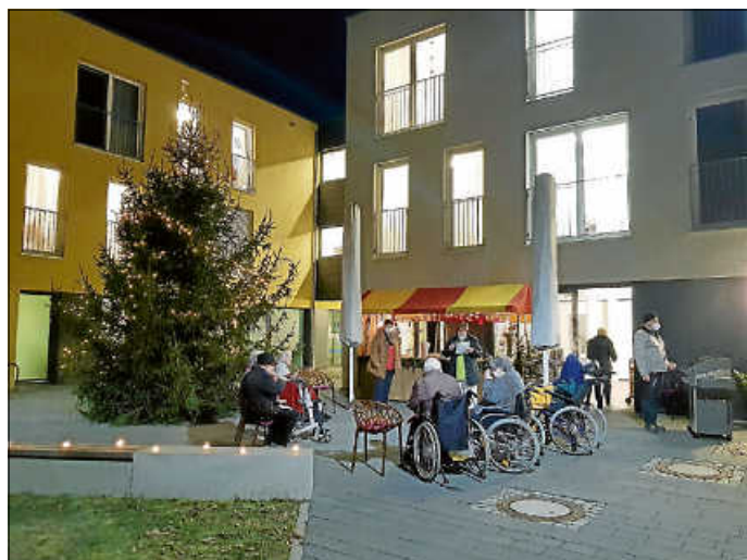
Vorweihnachtliche Stimmung im Palmschen Garten

Wir sind froh, dass durch die corona-bedingten stark eingeschränkten Aktivitäten der Ehrenamtlichen die Verbundenheit zu den Bewohnern eher verstärkt wird. Trotzdem hoffen wir mit den Bewohnern, dass bald wieder die gewohnten Veranstaltungen stattfinden können. Denn uns fehlen diese persönlichen Kontakte genauso wie den Bewohnern.