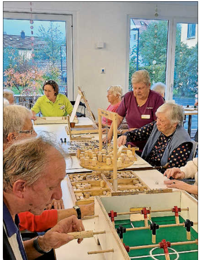
Die unterschiedlichsten Holzspiele begeistern die Bewohner des Palmschen Gartens