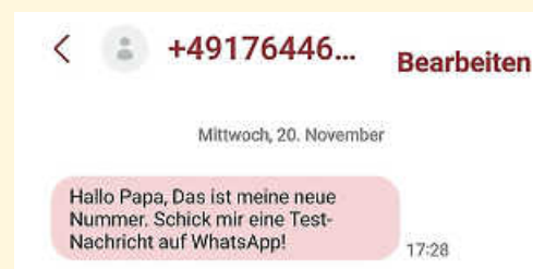
Masche bei Smishing

Smishing: Smishing ist eine Form des Phishings, die über SMS-Nachrichten stattfindet. Kriminelle verschicken gefälschte SMS, die zu einer Webseite oder zu einem Anruf auffordern, um so an Ihre sensiblen Informationen zu gelangen. Auch hier wird häufig ein Dringlichkeitsgefühl erzeugt, um Sie zur schnellen Reaktion zu bewegen. Bei einer anderen Masche geben Kriminelle vor, dass ein erwartetes Päckchen demnächst eintreffe. Das Opfer wird aufgefordert, dies durch Antippen eines Links zu bestätigen. Allein schon das Antippen des Links könnte das Herunterladen von Schadsoftware auslösen.