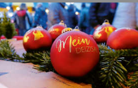
Verkauf im Rathaus

Besuchen Sie uns unter www.deizisau.de und www.meindeizisau.de Diese Ausgabe erscheint auch online unter www.lokalmatador.de