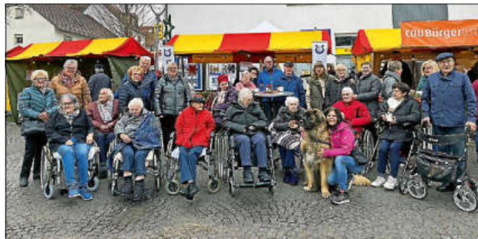
Die Bewohner mit ihrer Begleitung auf dem Weihnachtsmarkt

Eine stattliche Anzahl von Bewohnerinnen und Bewohnern hatten am vergangenen Sonntag Gelegenheit, den Deizisauer Weihnachtsmarkt zu besuchen. Begleitet von unseren Ehrenamtlichen kamen sie in den Genuss, die zahlreichen Weihnachtsstände und deren Angebote zu bewundern. Weihnachtliche Gerüche lagen überall in der Luft. Interessante Bastelarbeiten wurden entdeckt und handgemachter Schmuck bestaunt. Kuschelig weiche Angorawolle weckte genau so Interesse wie die Stände, an denen weihnachtliches Gebäck und Getränke angeboten wurden.