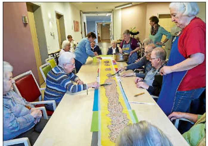
Maultaschenproduktion am Band