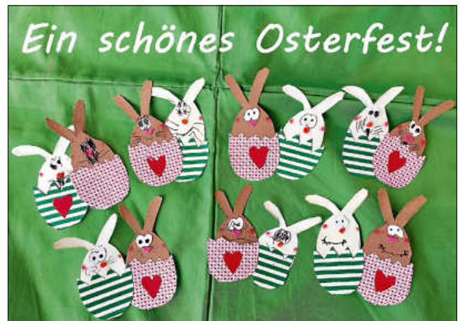
Süße Bastel-Kunstwerke unserer Vorlesekinder

Die Bücherei hat während der Osterferien zu den gewohnten Zeiten geöffnet, außer am Karfreitag.