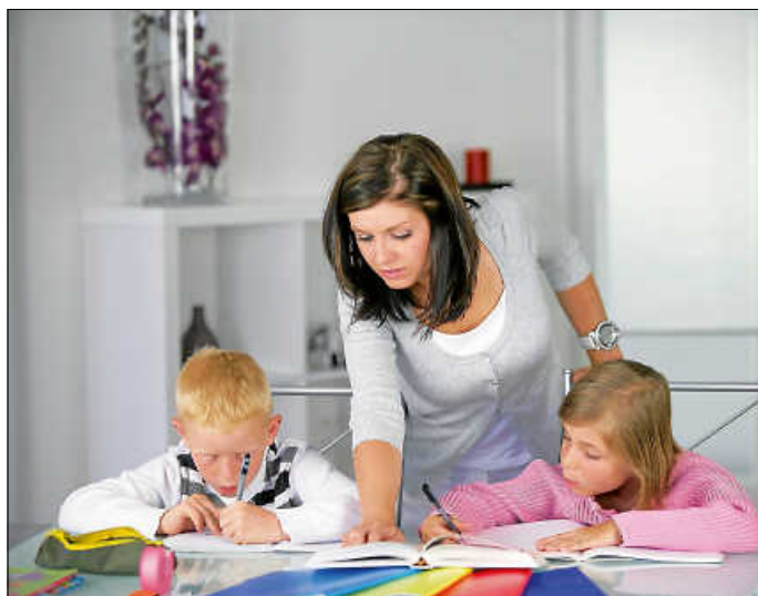
Kindertagespflege im eigenen Zuhause

Weitere Informationen finden Sie auch auf unserer Homepage www.tev-kreis-es.de .