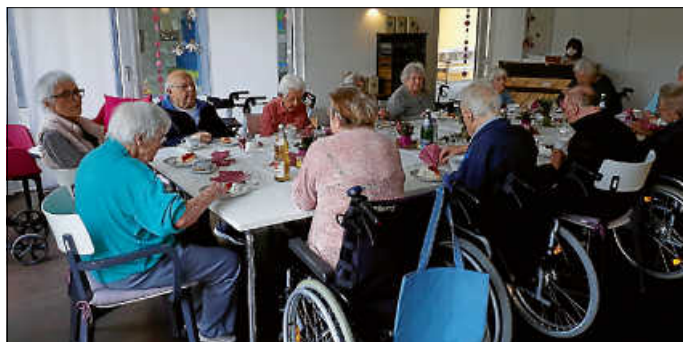
Die Bewohner des ersten Wohnbereichs genießen Kaffee und Kuchen