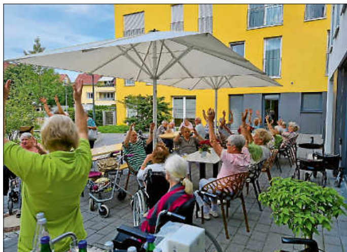
Die Bewohner gestalten ihren Unterhaltungsmittag aktiv mit