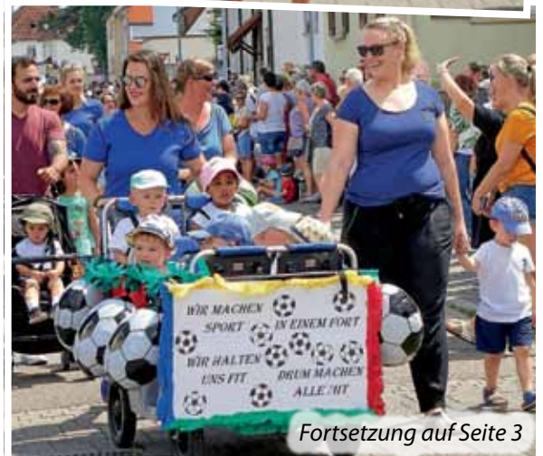
Fortsetzung auf Seite 3