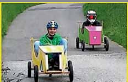
Sonntag, 29. September