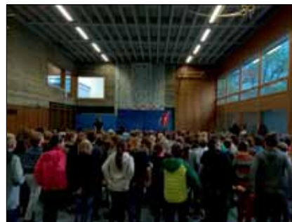
Lockerungsübungen in der Sporthalle

Die Grundschüler singen viel, sie singen laut und manchmal auch leise, aber vor allem singen sie so gut, dass sie jetzt sogar mit einer „Goldenen Schallplatte“ ausgezeichnet wurden. Die Kinder der Grundschule haben im Rahmen des Projektes „Minimusiker“ eine CD aufgenommen – ganz wie echte Profis! An diesem Tag wurde der Musiksaal flugs in ein professionelles Tonstudio verwandelt.