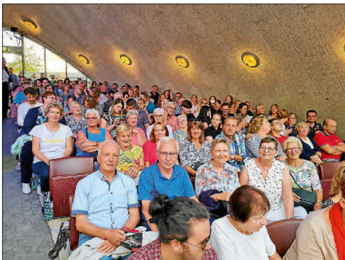
Die Ehrenamtlichen genießen die Aufführung im Theater „Unter den Kuppeln“

Wir bedanken uns bei den Organisatoren und vor allem bei unserem Förderverein, der Altenhilfe Plochingen-Altbach-Deizisau e.V., die auch diese Veranstaltung gesponsert hat.