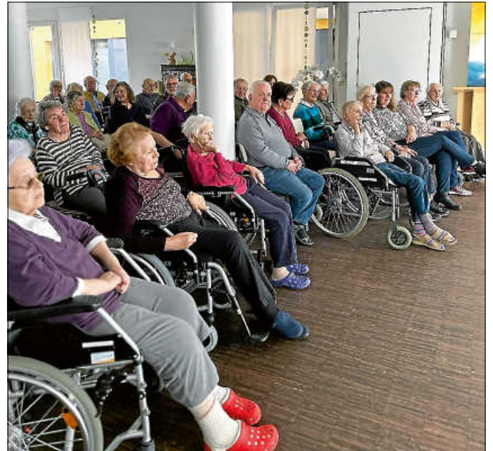
Aufmerksame Zuhörer beim Klavierkonzert

Wir wünschen jedenfalls allen drei Jugendlichen weiterhin viel Freude am Klavierspielen, bedanken uns für ihr Kommen.