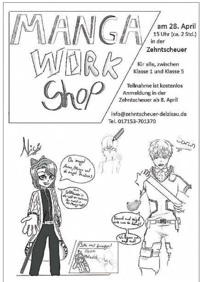
Plakat: Alice und Sarah

Nächster Termin: 19. April: Wir gestalten Plakate und Buttons, denn am Samstag wird in Deizisau für unsere Demokratie eine Aktion stattfinden – und da wollen wir gut vorbereitet sein.