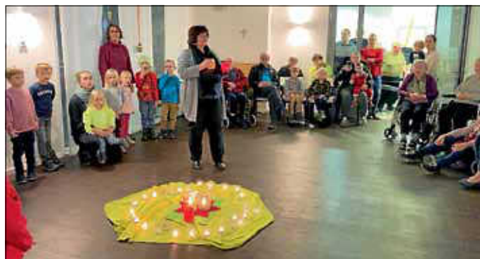
Die Kinder tragen ein Licht in die Welt