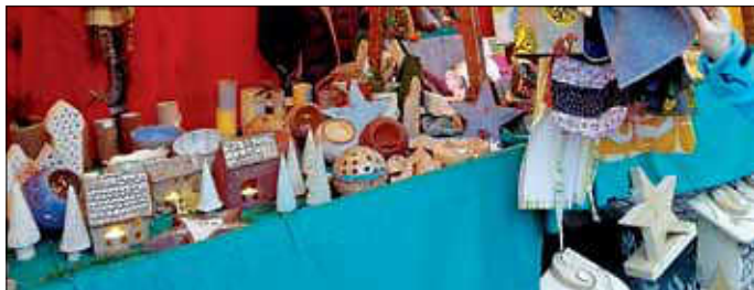
Produkte aus der Keramikwerkstatt

ihre regelmäßigen Käufer und konnten diesmal zusammen mit Seifenschalen aus Keramik erworben werden. Im Angebot hatte der AK Asyl auch Weihnachtsdeko aus Keramik und Holz, Taschen und Körbe aus Stoff sowie Insektenhotels und Feuerkörbe. Wer noch vor Weihnachten etwas erwerben möchte, findet die Produkte in der Ausstellung in der Zehntscheuer. Dort können die Stücke auch gekauft werden. Vielen Dank an alle Teilnehmer der Werkstätten und alle Helfer bei Aufbau, Standdienst und Abbau.