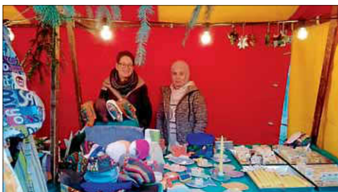
Stand des AK Asyl