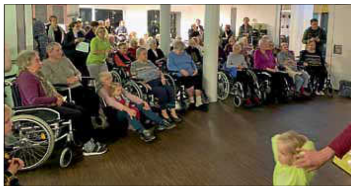
Gäste beim Lebendigen Adventskalender

Diese gelungene Veranstaltung zeigte wieder einmal, was durch eine gute Zusammenarbeit unter dem Dach eines Hauses geschaffen werden kann. Dafür gilt unser Dank den Erzieherinnen des Kindergartens Palmscher Garten sowie den Haupt- und ehrenamtlichen Kräften unseres Seniorenhauses. Doch der schönste Dank kommt wie immer von den Bewohnerinnen und Bewohnern unseres Hauses, denn da klingt auch immer ein wenig Besinnlichkeit und sogar Nachdenklichkeit mit. Für alle, die beim diesjährigen „Lebendigen Adventskalender“ nicht dabei sein konnten, sei zum Trost gesagt: im nächsten Jahr öffnen wir wieder ein Türchen vom „Lebendigen Adventskalender“.