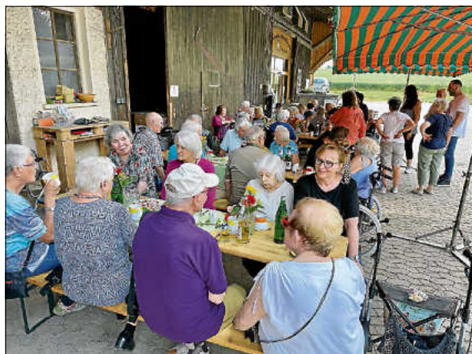
Die Bewohner genießen ihr Fest