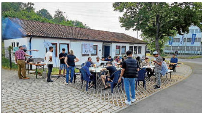
Grillfest am Campus

Wir freuen uns über weitere Unterstützung und weitere engagierte Mitstreiter/innen.