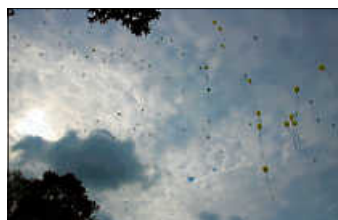
199 Luftballons auf ihrem Weg zum Horizont

In diesem Jahr blicken wir auf ein ganz besonderes Klein NeFingen zurück: Zum ersten Mal hatten wir zwei Stadtteile und vieles war ein bisschen anders als in den vergangenen zehn Jahren. Und dennoch war auch einiges den Kindern und dem Mitarbeiter*innenteam vertraut – so ein klein bisschen auch wie immer. Stolz sind wir auf die Kinder und unser wunderbares Mitarbeiter*innen-Team, die unseren Klein NeFingen-Alltag bunt und fröhlich gestaltet haben. Und dankbar sind wir den Eltern, die uns das Vertrauen geschenkt haben, dass wir Klein NeFingen gemeinsam mit ihren Kindern "rocken" durften. Ein dickes Dankeschön geht auch an alle, die uns mit Sachspenden und finanziellen Zuwendungen unterstützt haben und an die beiden Gemeindeverwaltungen Wernau und Deizisau, die tatkräftig und mit vielfältigen Unterstützungsformen alles mit möglich gemacht haben.