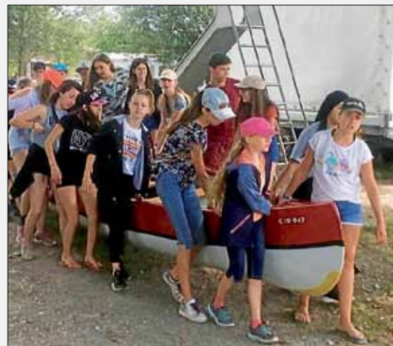
Erst die Arbeit, dann das Vergnügen!