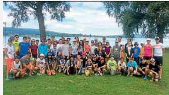
Die Lerngruppen 7 mit ihren Lehrerinnen und Lehrern

Am zweiten Tag mussten wir früh morgens aufstehen, denn eine Kanutour um die Insel Reichenau stand auf dem Programm. Bei phantastischem Badewetter begaben wir uns gegen 10:00 Uhr auf den Campingplatz Hegne.